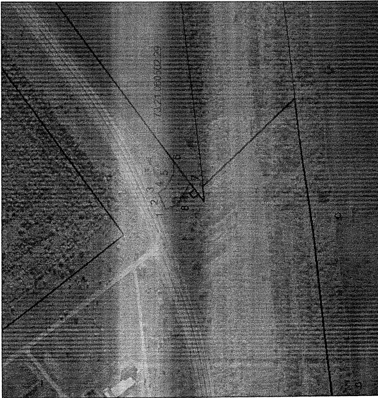
СХЕМА РАСПОЛОЖЕНИЯ ГРАНИЦ СЕРВИТУТА Для строительства магистрального водовода до п. Октябрьский Чердаклинского района Ульяновской области. Монтаж насосных агрегатов на НС СВП Левобережья, проходящего в кадастровом квартале 73:24:021114

Координаты характерных точек границ сервитута